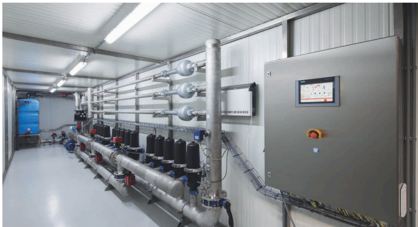
Chemievrije koelwaterbehandelingsinstallatie van Pathema om kalk, corrosie en microbiologische groei te voorkomen.

neemt de urgentie voor bedrijven als Lamb Weston/Meijer om drinkwater te besparen toe. Bovendien wil de aardappelverwerker in 2025 zoveel mogelijk circulair zijn en staat het sluiten van de waterkringloop hoog op de duurzaamheidsagenda. Alle apparaten die water verdampen om te koelen, dus ook koeltorens, krijgen te maken met kalkaanslag, corrosie en microbiologische groei. De laatste decen-