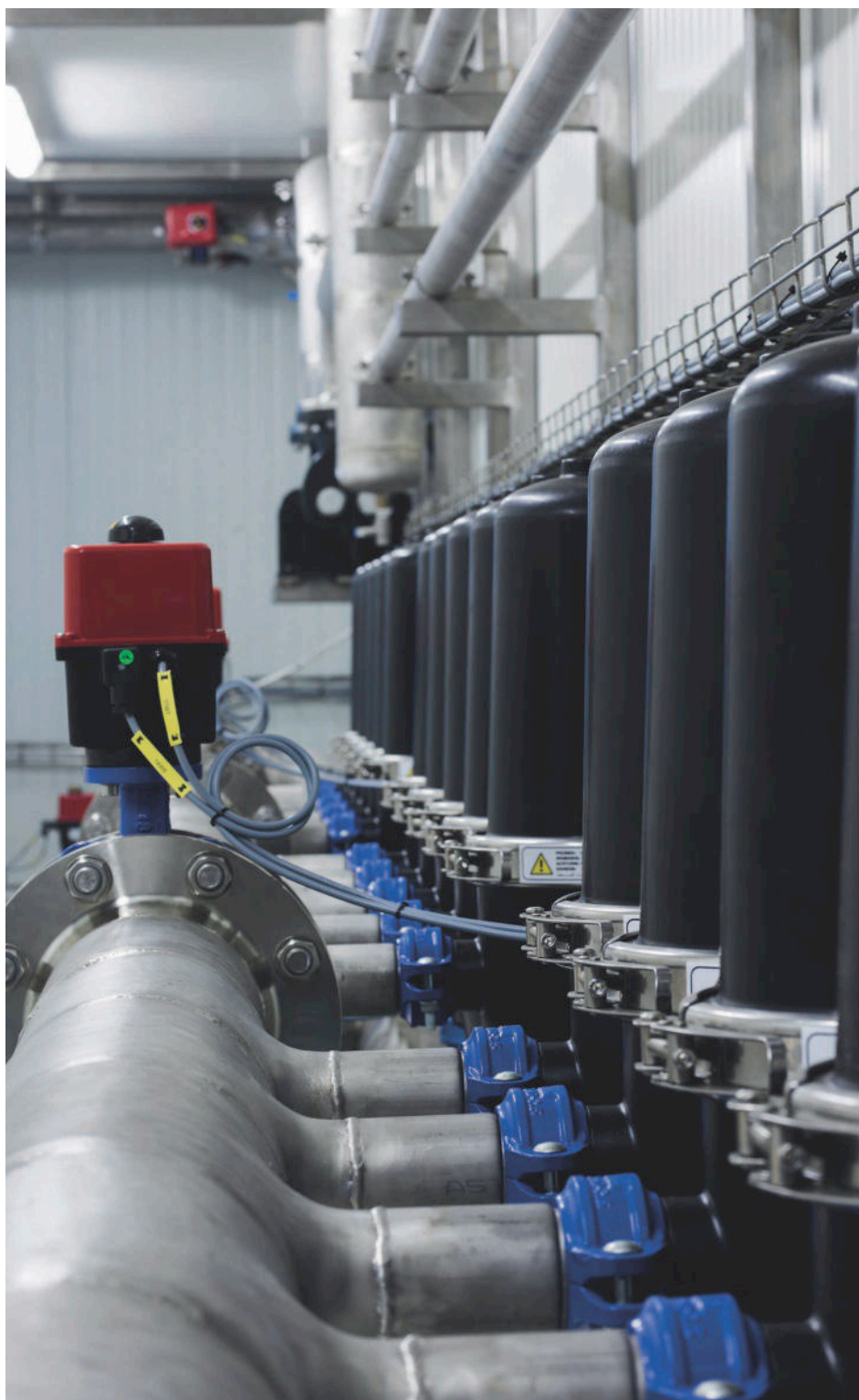
Disc filtratie om vaste deeltjes af te filteren en spuiwater daarna te kunnen hergebruiken.

De stoomketels en koeltorens worden daarna gevoed met dit gerecyclede (afval)water. Hierdoor is het niet meer nodig om ontharders in te zetten die op basis van zout het drinkwater volledig ontharden ten