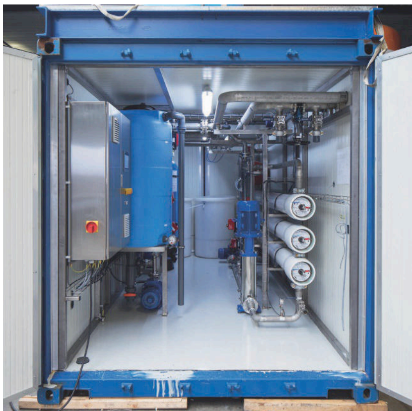
De installatie van Pathema kan volledig worden geplaatst in een (of meerdere) zeecontainer(s).

"Ook al kost drinkwater niet veel, afvalwater is gratis en lozen kost ook geld"